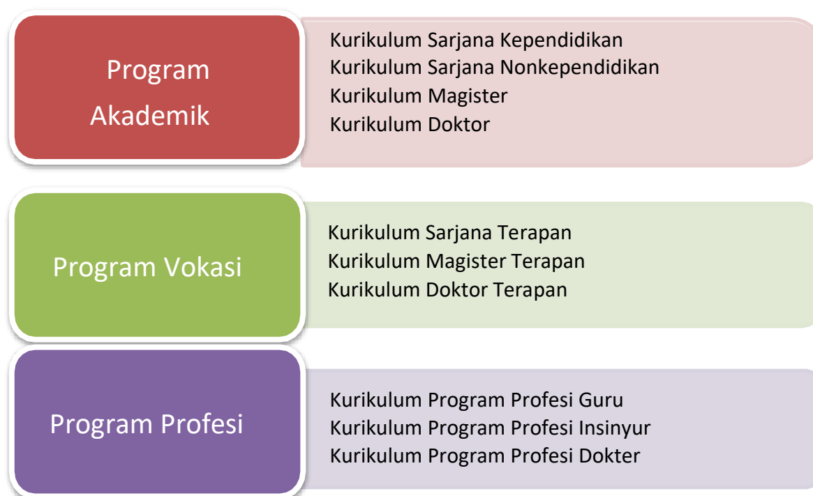
Gambar 2. Model Kurikulum UNY

Pada panduan ini dijelaskan model kurikulum untuk Bidang Akademik dan Program Vokasi. Model kurikulum Bidang Akademik meliputi Program Sarjana Kependidikan, Sarjana Nonkependidikan, Magister dan Doktor. Program Vokasi hanya dibahas Kurikulum Sarjana Terapan.